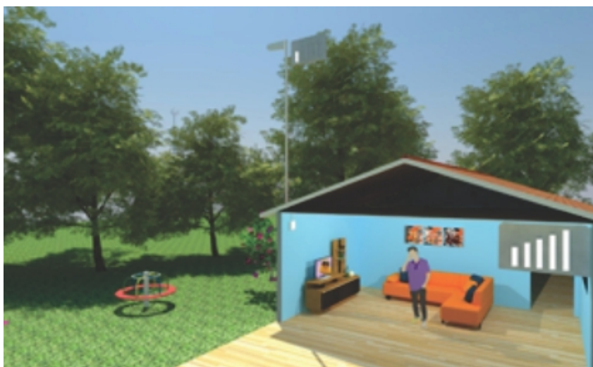
Sujeito a alterações sem aviso prévio